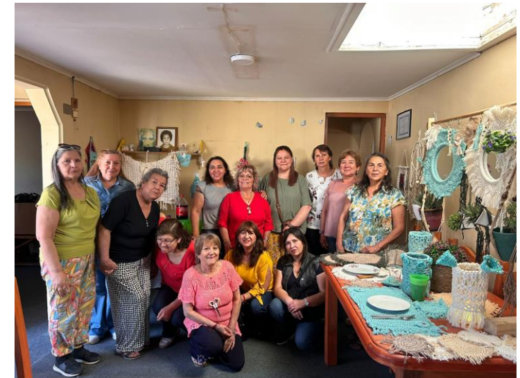
Fondo Concursable San José de Maipo 11° versión "Ceremonia Club de amigas Eugenia Mella".

Implementamos, medimos y reportamos la inversión social, con el objetivo de optimizar los recursos y sean un aporte objetivo al desarrollo local de nuestras comunidades.